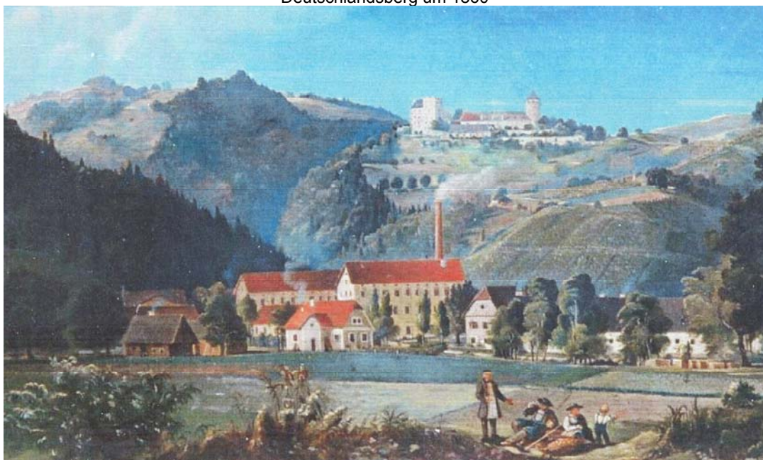
Deutschlandsberg Papierfabrik und Burg um 1872