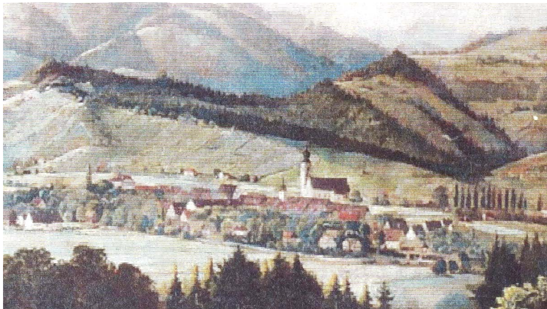
Deutschlandsberg um 1860

Anhang: drei oder vier Bilder von Maler Jakob Wibmer (1814 – 1881), der in dieser Zeit als einziger weststeirischer Künstler in Deutschlandsberg ansässig war und im verfallendem Burgturm unter kümmerlichen Bedingungen beachtliche Werke schuf.