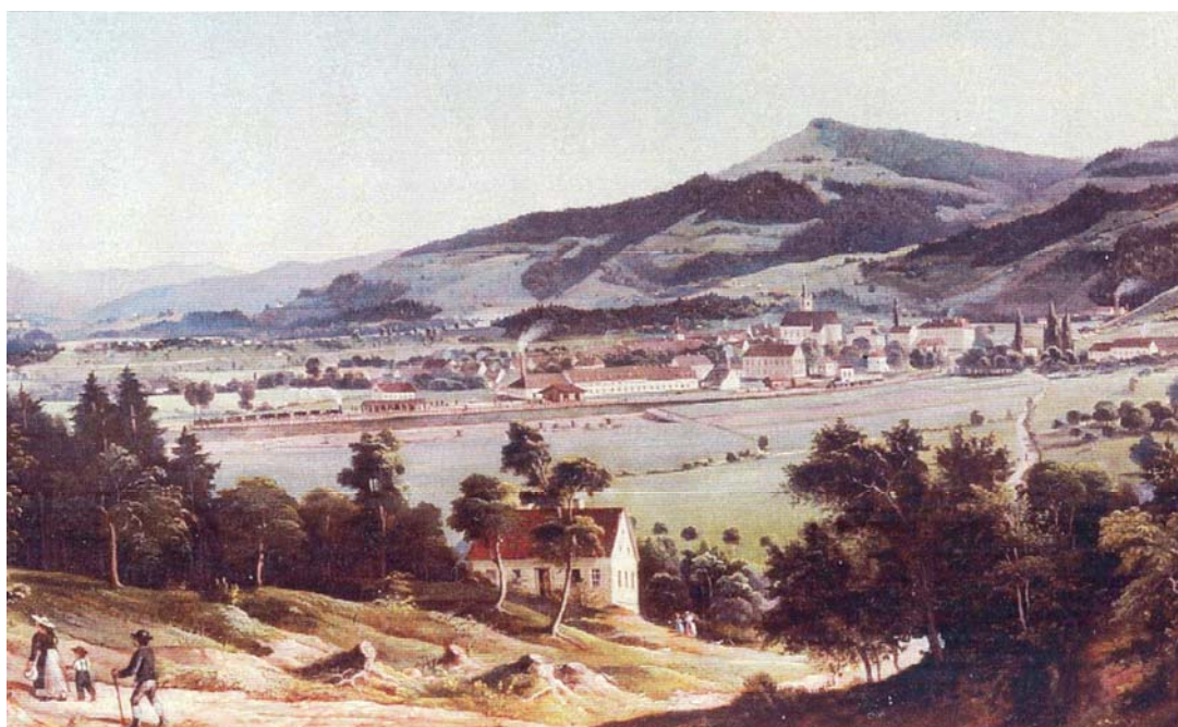
Deutschlandsberg mit Bahn um 1875

Quellen: Fabriksordnung und Statuten der Krankenkasse der k. k. priv. Zündwarenfabrik Fl. Pojatzi von 1874. Herbert Kriegl, Aus Deutschlandsbergs kultureller Vergangenheit, Josef Wallner Tagebuch MS, Werner Tscherne, Von Lonsperch zu Deutschlandsberg. Hans Wilfinger, Deutschlandsberg im 19. Jahrhundert, Verfall und Aufstieg, Tageszeitungen: Grazer Tagespost und Volksblatt. Bilder von Jakob Wibmer, aus der Diplomarbeit von Horst Biemann: „Jakob Wibmer 1814 – 1881“, Graz 2006.